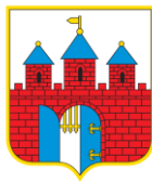
PATRONAT HONOROWY PREZYDENTA BYDGOSZCZY Rafała Bruskiego