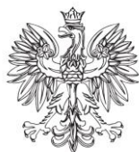
WOJEWODA KUJAWSKO-POMORSKI MICHAŁ SZTYBEL

Patronat honorowy nad wydarzeniem objęli: